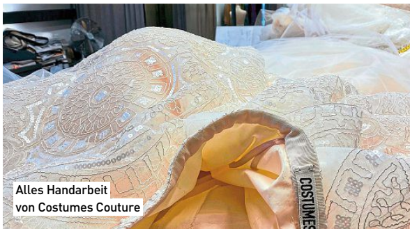
Alles Handarbeit von Costumes Couture

TRENDS @isabella.klausnitzer@kurier.at www.isatrends.at @isaklausnitzer isaklausnitzer