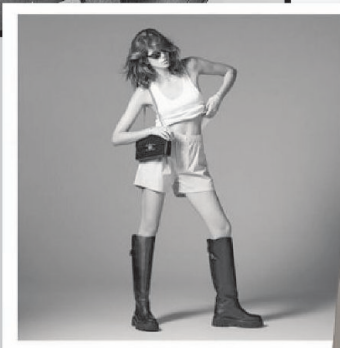
Kaia Gerber wirbt für Celine