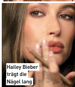
Hailey Bieber trägt die Nägel lang