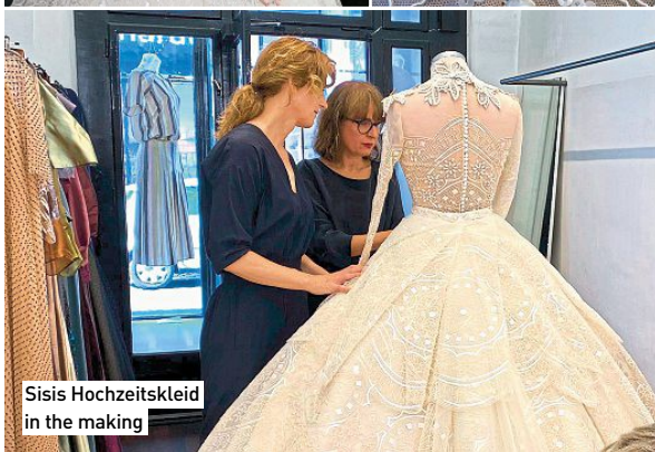
Sisis Hochzeitskleid in the making