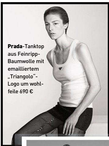
Prada-Tanktop aus Feinripp-Baumwolle mit emailliertem „Triangolo“-Logo um wohlfeile 690 €