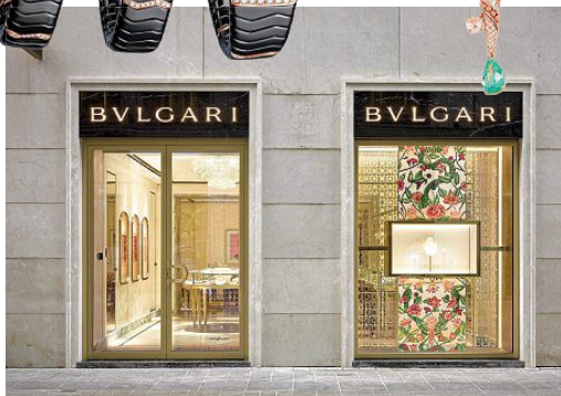
Wiener Bulgari-Boutique am Kohlmarkt 4