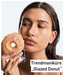
Trendmaniküre „Glazed Donut“